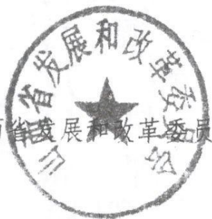
山西省发展和改革委员会