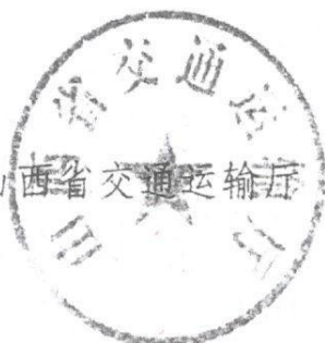
山西省交通运输厅