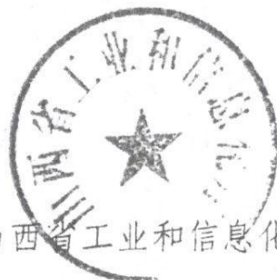
山西省工业和信息化厅