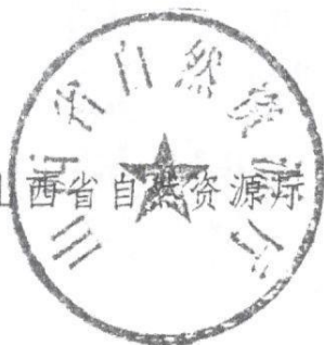
山西省自然资源厅