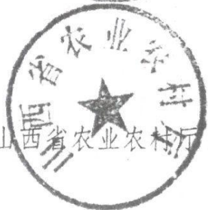
山西省农业农村厅