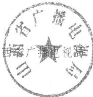
山西省广播电视厅