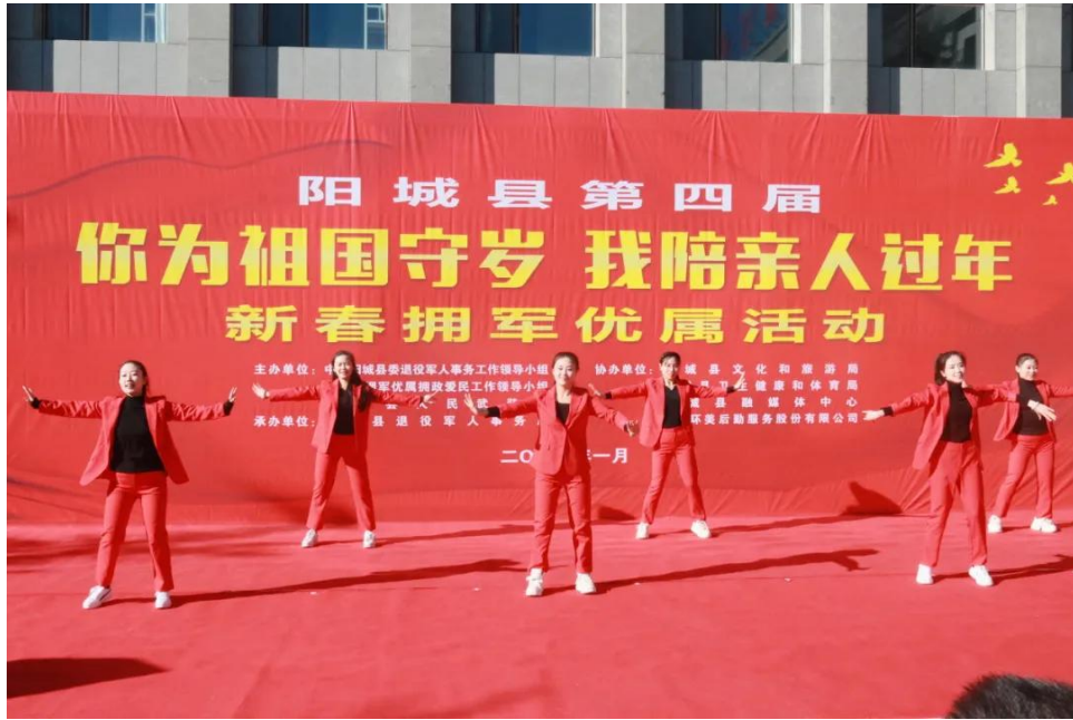
▲青春舞曲《舞动青春》