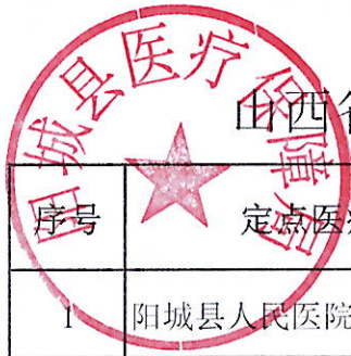
山西省阳城县医保定点医疗机构信息统计表