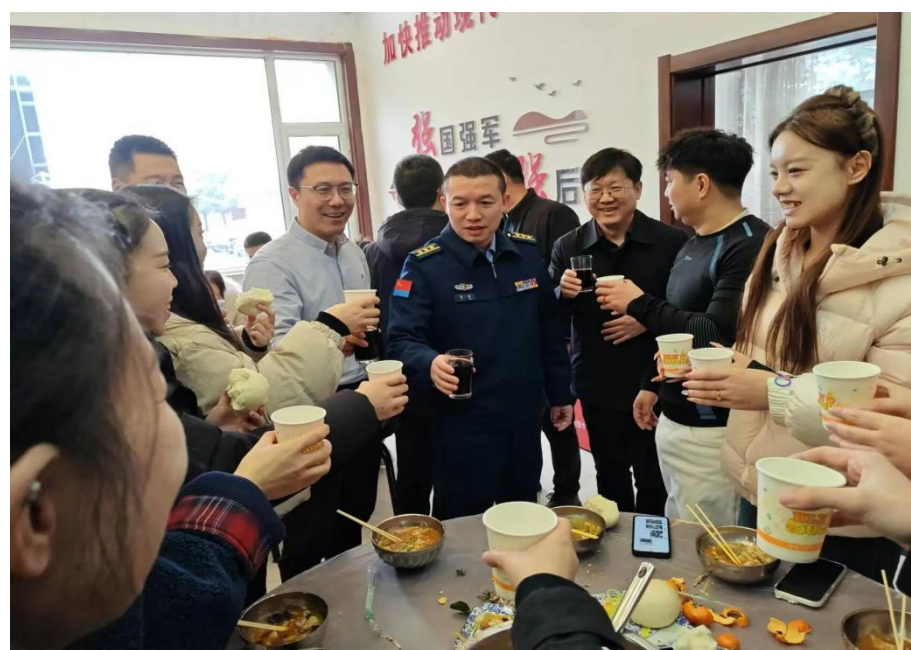
▲ 军人家属、人武部官兵与地方领导共进拥军餐。