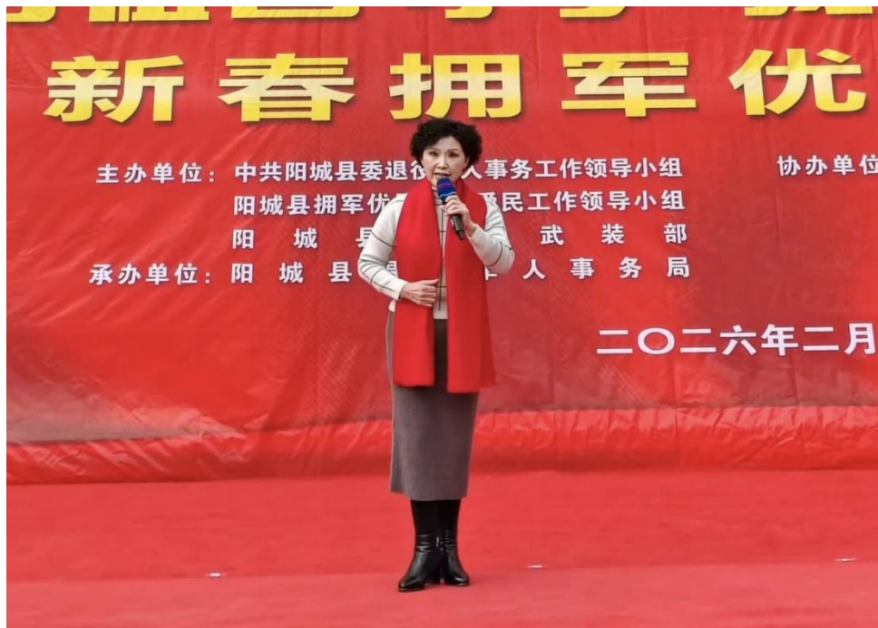
▲白爱蒲梆子清唱《申纪兰，我的级别是农民》。