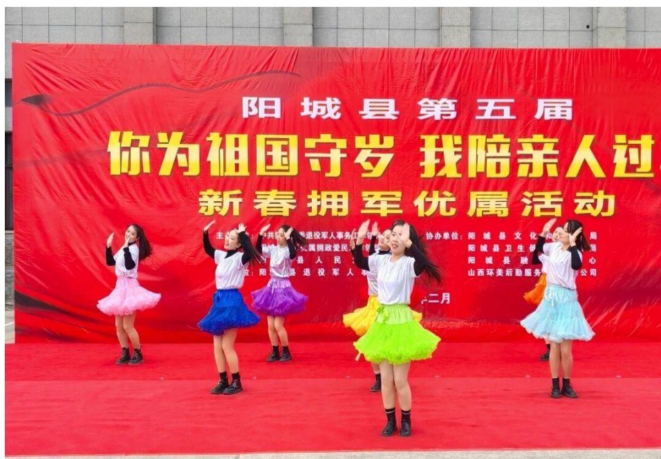
▲现代舞《我们都是追梦人》。