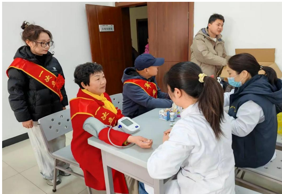
▲活动现场县医疗集团医生为军属送诊、送药。